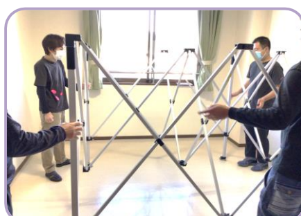
【簡易陰圧テント組み立て中】